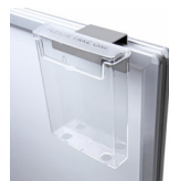
(WTGHOD) LEAFLET HOLDER PROSPEKTHALTER